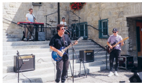
Flawiler Band «Adenite»