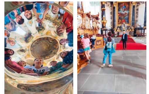
Minis besichtigen den Dom und sehen im Taufbecken in die himmlische Kuppel.