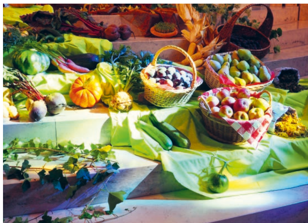
Liebevoll geschmückte Kirche durch die Bäuerinnen