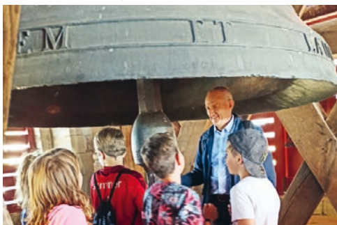
Minis in der Kathedrale St. Gallen